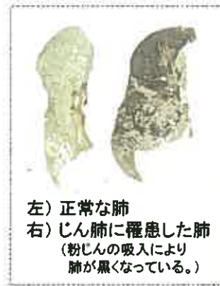
左) 正常な肺 右) じん肺に罹患した肺 (粉じんの吸入により肺が黒くなっている。)

現在、じん肺を治す根本的な治療がないため、じん肺にかからないための措置として、粉じんの発生源対策、局所排気装置等の適正な稼働、呼吸用保護具の適正な着用などにより、粉じんへの「ばく露防止対策」を徹底することが重要です。